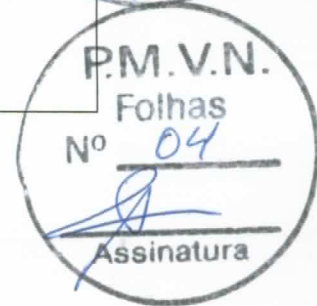
Márcio Vale Secretário de Cultura Vigia - Pará