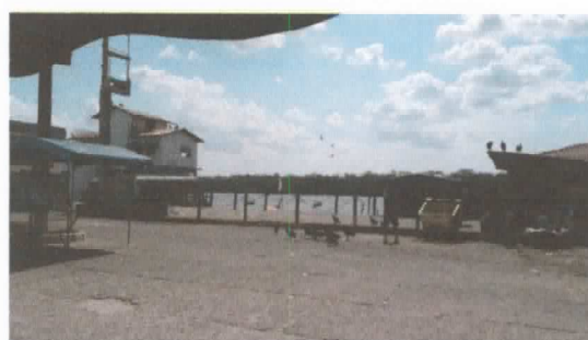
Área destinada a construção do galpão