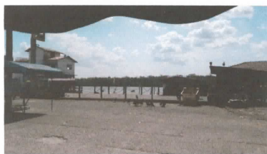
Área destinada a construção do galpão