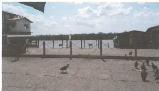
Área destinada a construção do galpão