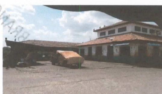
Área destinada a construção do galpão