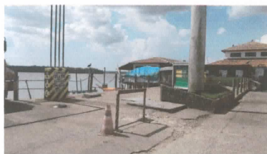
Área destinada a construção do galpão