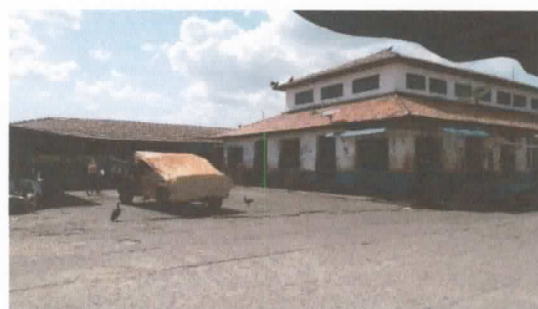
Área destinada a construção do galpão